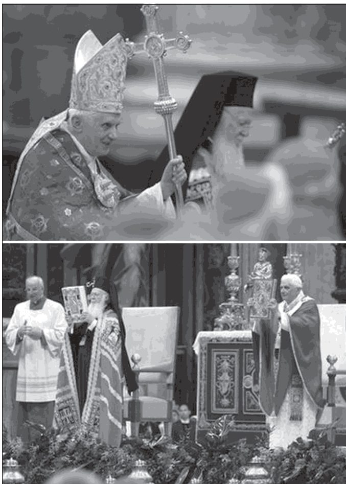
29 июня Папа Римский Бенедикт XVI отслужил торжественную мессу в соборе Святого Петра совместно с Константинопольским Патриархом Варфоломеем I.

Иоанна Павла II в 2005 году кардинал Йозеф Ратцингер, ныне Папа Римский Бенедикт XVI, отметил: «Мы уверены, что любимыми нами Папа сегодня представлял перед Господом Богом в его обители». Ватиканский эксперт Витторио Мессори сказал тогда: «Если он в раю, то он святой», и многим другим показалось, что кардинал Ратцингер неофициально канонизировал покойного Папу.