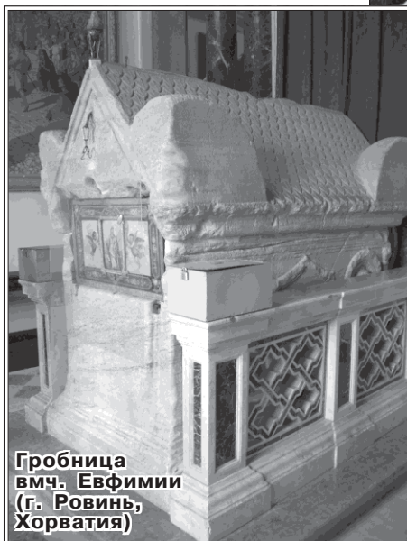
Гробница вмч. Евфимии (г. Ровинь, Хорватия)

тельно осуждена, мощи святой Евфимии торжественно перенесли в Константинополь, в ту самую церковь, где они почивали ранее. Несмотря на последующие разорения города крестоносцами и мусульманами, православные сумели сохранить честные останки великомученицы и сегодня они почивают в церкви святого Георгия Победоносца – главном храме Константинопольской Патриархии, расположенном в стамбульском районе Фанар.