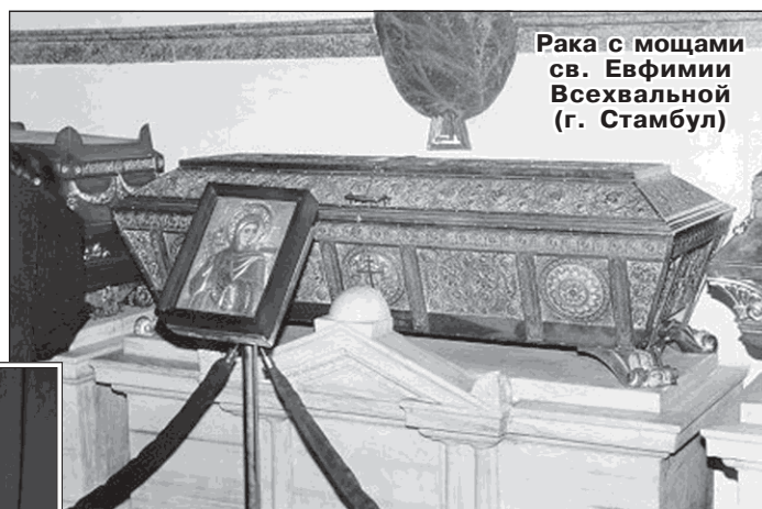
Рака с мощами св. Евфимии Всецельной (г. Стамбул)

Когда на VII Вселенском Соборе (787 г.) иконоборческая ересь была оконча-