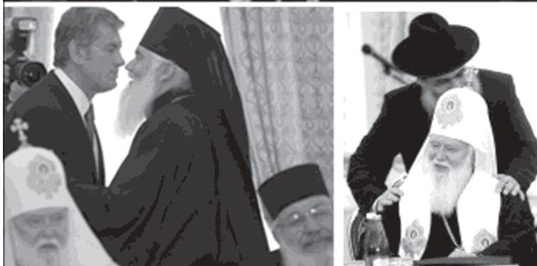
Встреча Виктора Ющенко с представителями Всеукраинского Совета Церквей и религиозных организаций

гласия, «достижения большей толерантности в тех вопросах, где еще такой толерантности мы не наблюдаем».