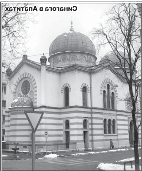
Храм Христа Спасителя