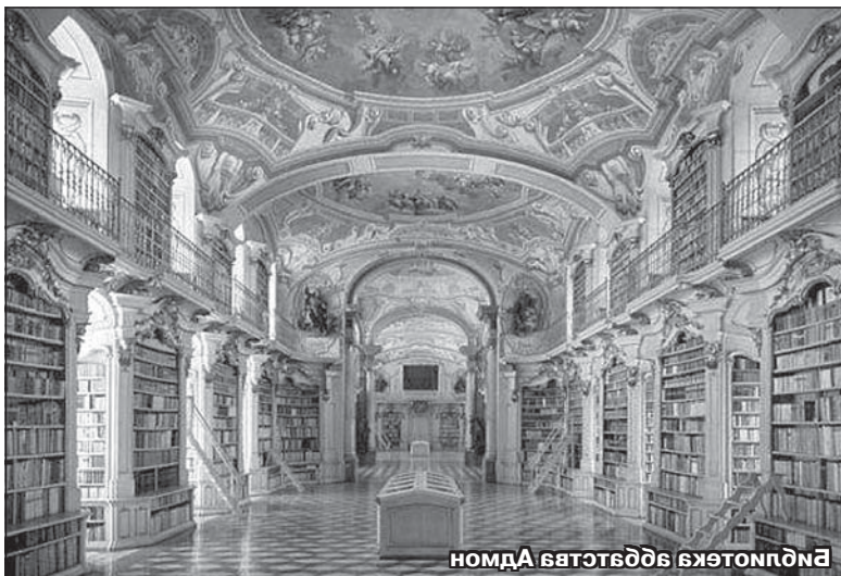
Библиотека в здании университета

Библиотека в здании университета является одним из самых красивых и богатых библиотечных комплексов в мире. Она была основана в 1622 году и с тех пор постоянно пополняется новыми изданиями. В настоящее время в библиотеке хранится более 1 миллиона книг, а также редкие рукописи и старинные издания. Библиотека открыта для всех желающих и предоставляет широкий спектр услуг, включая консультации и помощь в поиске информации.