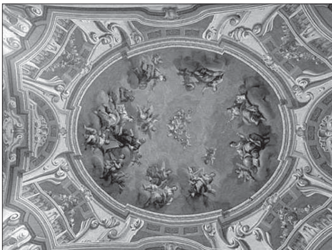
Библиотека в здании университета

Вопрос о возможности использования ресурсов «только для личного использования» в интернете и в социальных сетях является актуальным. Многие пользователи считают, что если они используют ресурсы только для себя, то это не нарушает авторских прав. Однако, согласно законодательству, использование ресурсов «только для личного использования» не освобождает пользователя от ответственности за нарушение авторских прав. Поэтому, если вы используете ресурсы «только для личного использования», вы должны убедиться, что вы не нарушаете авторских прав.