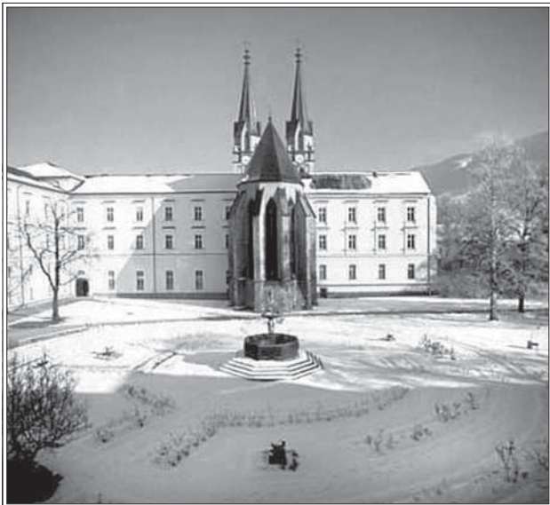
Здание университета в городе

Библиотека в здании университета является одним из самых красивых и богатых библиотечных комплексов в мире. Она была основана в 1622 году и с тех пор постоянно пополняется новыми изданиями. В настоящее время в библиотеке хранится более 1 миллиона книг, а также редкие рукописи и старинные издания. Библиотека открыта для всех желающих и предоставляет широкий спектр услуг, включая консультации и помощь в поиске информации.