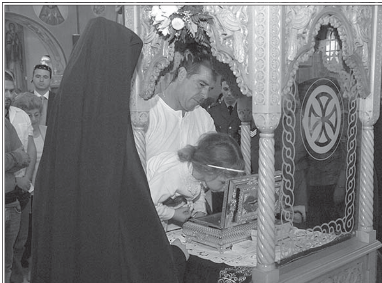
Мощан прп. Серафима Саровского за первые 3 дня пребывания в Афинах поклонилось 20 000 человек.

«Определенная антироссийская политика наблюдается и в украинских СМИ, – ради справедливости отмечает протоиерей. – Наверное, такие же расположения духа наблюдаются и в СМИ других стран СНГ и Балтии, в большей или меньшей мере – это уже другой вопрос. С одной стороны, можно понять руководство государств бывшего СССР, ведь информационная политика является составной частью системы обороны страны. Однако то, что мы наблюдаем в последнее время в российско-украинских отношениях, переходит любые границы».