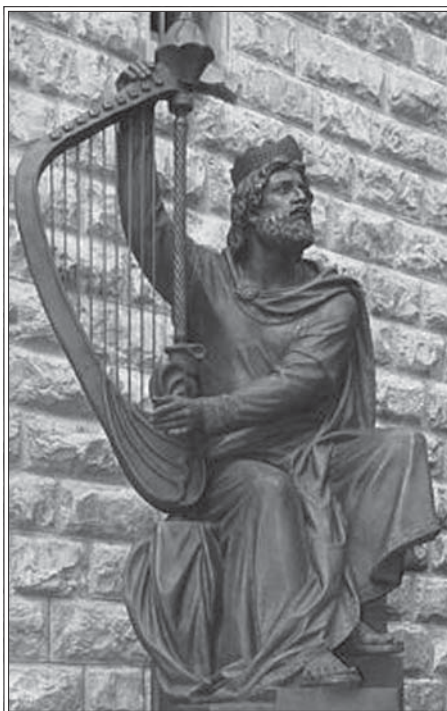
7 октября на горе Сион по инициативе российского Фонда святителя Николая Чудотворца был установлен памятник царю и пророку Давиду

«Фюрером и идеологом этой ультраправой мистической организации является аргентинский профессор Хорхе Анхель Ливрага. В 1957 г. он издал сборник под названием «Учебник руководителя». Сборник состоит из двух частей – «Золотая секира» и «Лабиринты Ляпис-лазури». Как заявляет его автор, главная задача «Нового Акрополя» – «создать из человека сверхчеловека». По своей сути эта книга – жесткое руководство по установлению «нового порядка». В организации существует тайная военная структура безопасности, состоящая из глубоко законспирирован-