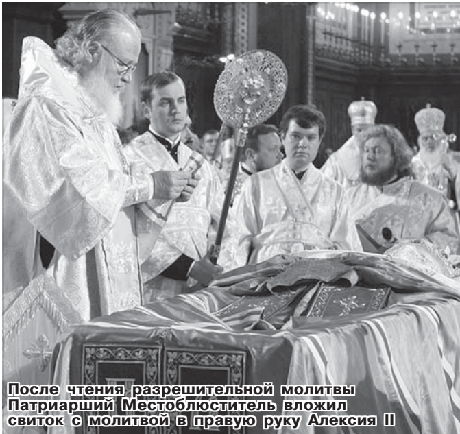
После чтения разрешительной молитвы Патриарший Местоблюститель вложил свиток с молитвой в правую руку Алексия II

траурный кортеж направился в Богоявленский кафедральный (Елоховский) собор. На протяжении этого шести-