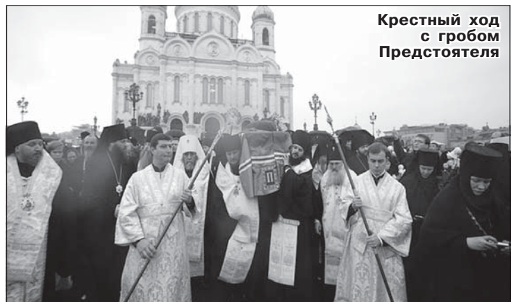
Крестный ход с гробом Предстоятеля

Служение последней заупокойной литии у гроба Святейшего Патриарха Алексия возглавил Местоблюститель Патриаршего Престола митрополит Смоленский и Калининградский Кирилл. За последним богослужением у гроба почившего Патриарха молились иерархи Русской Православной Церкви, представители Поместных Православных Церквей. Церемония погребения носила закрытый характер, поэтому представителей власти, общественных и политических деятелей в соборе не было.