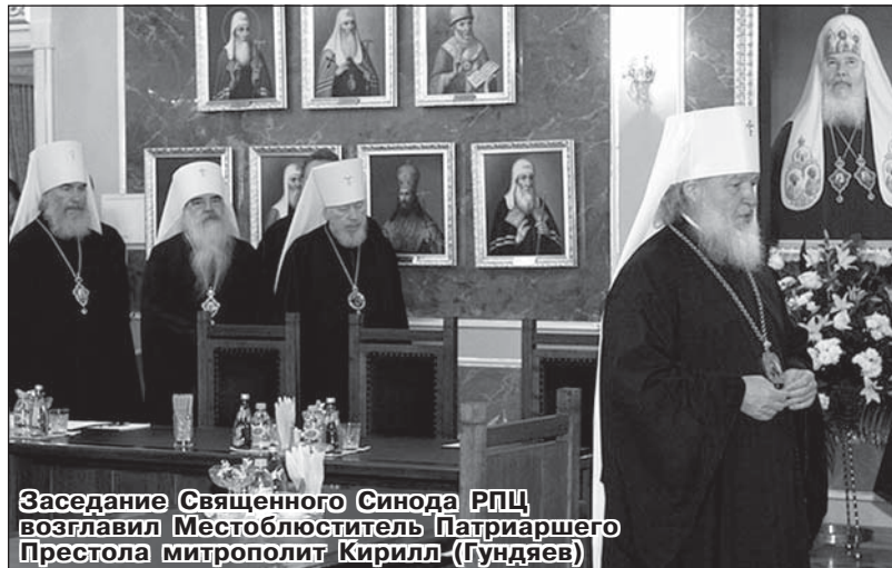
Заседание Священного Синода РПЦ возглавил Местоблюститель Патриаршего Престола митрополит Кирилл (Гундяев)

Инtronизация новоизбранного Патриарха состоится 1 февраля 2009 года.