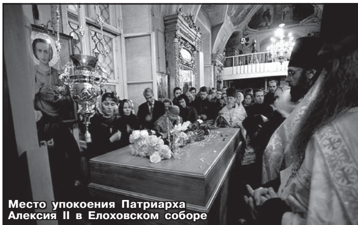
Место упокоения Патриарха Алексия II в Елоховском соборе

После прибытия к Богоявленскому собору гроб был перенесен от соборного сквера и установлен на кафедре в центре храма.