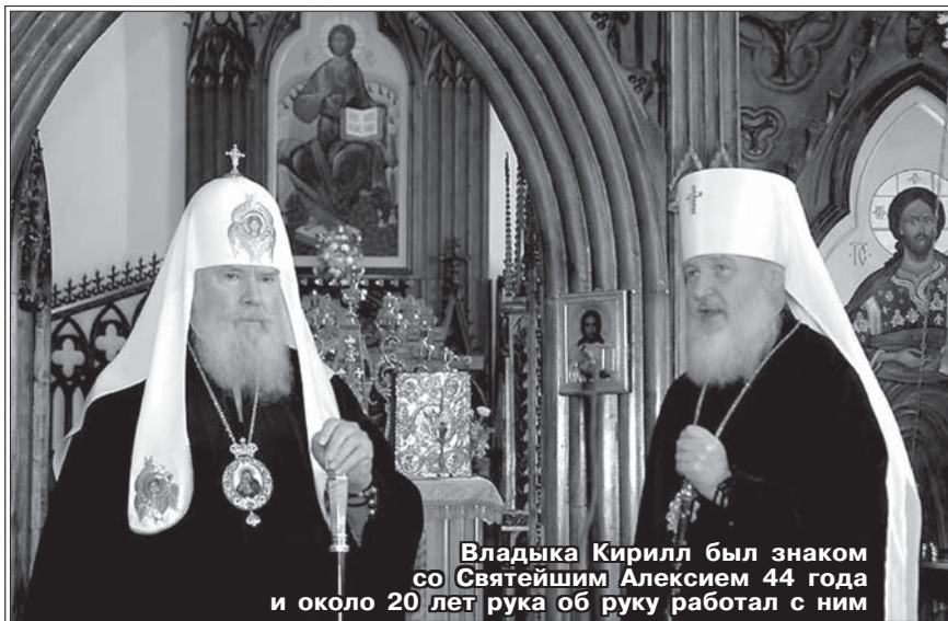
Владыка Кирилл был знаком со Святейшим Алексием 44 года и около 20 лет рука об руку работал с ним

первому разряду в 1949 году. Будучи на первом курсе Санкт-Петербургской духовной академии, Алексей Ридигер был рукоположен в сан диакона, а затем – в сан священника и назначен настоятелем Богоявленской церкви города Йыхви Таллиннской епархии. В 1953 году отец Алексий окончил Духовную академию по первому разря-