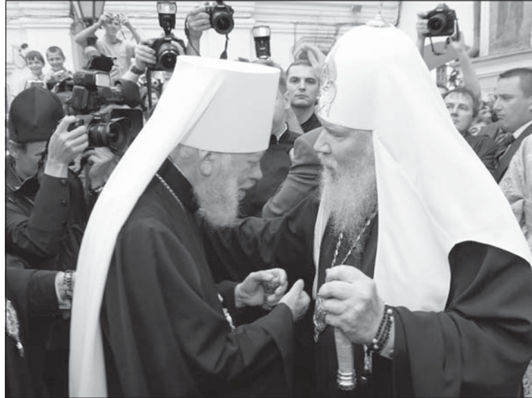
Встреча Патриарха с Блаженнейшим Митрополитом Владимиром на праздновании 1020-летия Крещения Руси 28 июля 2008 года в Киево-Печерской Лавре

Слово для книги «Жизненный путь Патриарха», которая готовилась к изданию в феврале 2009 года к 80-летию Святейшего Алексия Второго