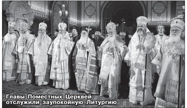
Главы Поместных Церквей отслужили заупокойную Литургию

До строительства и освящения Храма Христа Спасителя в Москве в 1996 году Елоховский собор был не только кафедральным московским, но и главным храмом всей страны. Именно здесь проходила в июне 1990 года интронизация Алексия II. Богоявленский собор в Елохове был построен в 1717-1722 годах. Храм никогда не закрывался, хотя в середине 1930-х годов был на грани закрытия. В 1933 году недалеко от собора размещалась канцелярия и резиденция Патриаршего Местоблюстителя митрополита Сергия. 2 июля 1938 года был закрыт собор Богоявления в Дорогомилово, после чего собор в Елохове стал патриаршим и кафедральным. Этот статус он сохраняет по сей день. Главная святыня собора – чудотворный образ Казанской иконы Богородицы, который был в ополчении князя Дмитрия Пожарского, освободившего Москву от захватчиков в 1612 году. Хранятся здесь и частицы мощей Николая Чудотворца, Андрея Первозванного, Серафима Саровского. Особое место в храме занимает рака с мощами Святейшего Алексия митрополита Московского, возглавлявшего Церковь в 14 веке. В честь этого святого был наречен в монашестве будущий Патриарх Алексий.