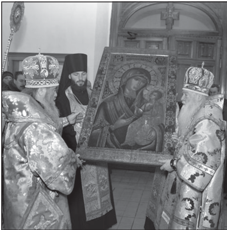
24 января из запасников Государственного исторического музея в Новодевичий монастырь была доставлена древняя Иверская икона Божией Матери. Православную святыню встречали митрополит Крутицкий и Коломенский Ювеналий, архиепископ Можайский Григорий с собором духовенства, сестры обители и множество верующих. Икона была перенесена в Успенский храм обители, после чего владыка митрополит совершил молебен, всенощное бдение и акафист перед чудотворным образом.

Теперь, согласно договору, заключенному между Новодевичьим монастырем и музеем, афонская Иверская икона вновь стала доступной для поклонения православных.