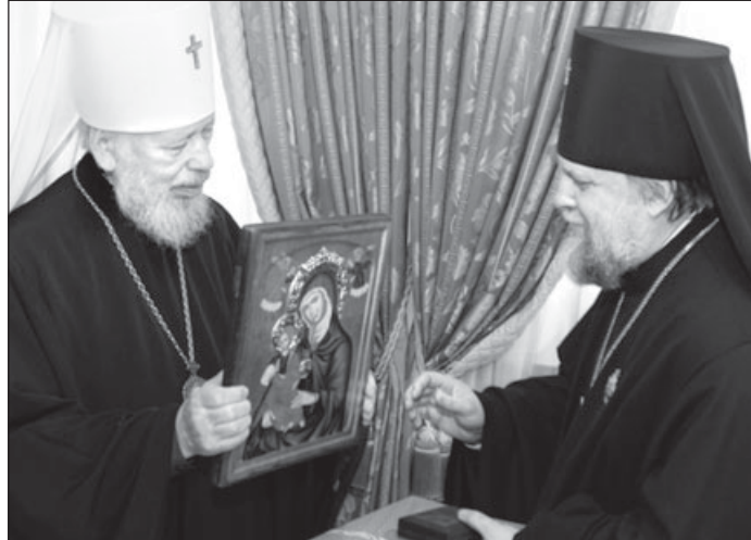
На увагу до церковних заслуг та з нагоди 60-річчя з дня народження Високопреосвященніший Іонафан (Слецьких), архієпископ Тульчинський і Брацлавський, отримав орден святого Апостола та Євангеліста Іоанна Богослова II ступеня

16-18 травня – Вінниця; 18-20 травня – Миколаїв; 20-22 травня – Сімферополь; 22-24 травня – Луганськ; 24-26 травня – Донецьк.