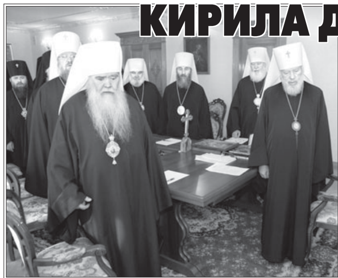
Священный Синод Украинской Православной Церкви официально запросил Святейшего Патриарха Московского и всея Руси Кирилла здійснити архіпа-