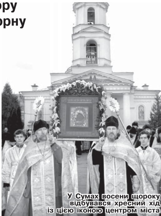
У Сумах восени щороку відбувався хресний хід із цією іконою центром міста

«СЕДМИЦА»: п/индекс – 96204, цена подписки на 1 месяц – 3,79 грн.