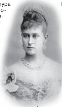
Елизавета Федоровна Романова

Генпрокуратура пришла к выводу, что «все вышечисленные лица подверглись репрессии в виде ареста, высылки и нахождения под надзором органов ЧК без предъявления обвинения в совершении конкретного преступления по классовым и социальным признакам», что позволяет признать их жертвами политических репрессий и «реа-