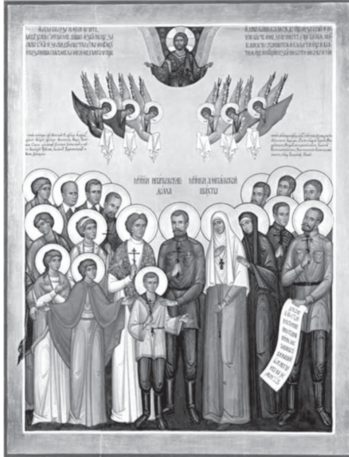
Икона святых новомучеников и исповедников Российских, пострадавших в Ипатьевском доме и Алапаевской шахте

Также весной 1918 года члены Российской императорского дома, находившиеся в Петрограде и его окрестно-