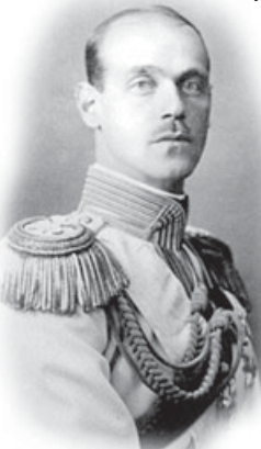
Михаил Александрович Романов

Тем самым был удовлетворен запрос княгини Марии Владимировны, которая требовала признать жертвами политических репрессий Великого князя Михаила Александровича, расстрелянного летом 1918 года в Перми, а также Великую княгиню Елизавету Федоровну, Великого князя Сергея Михайловича и троих князей Императорской крови: Иоанна,