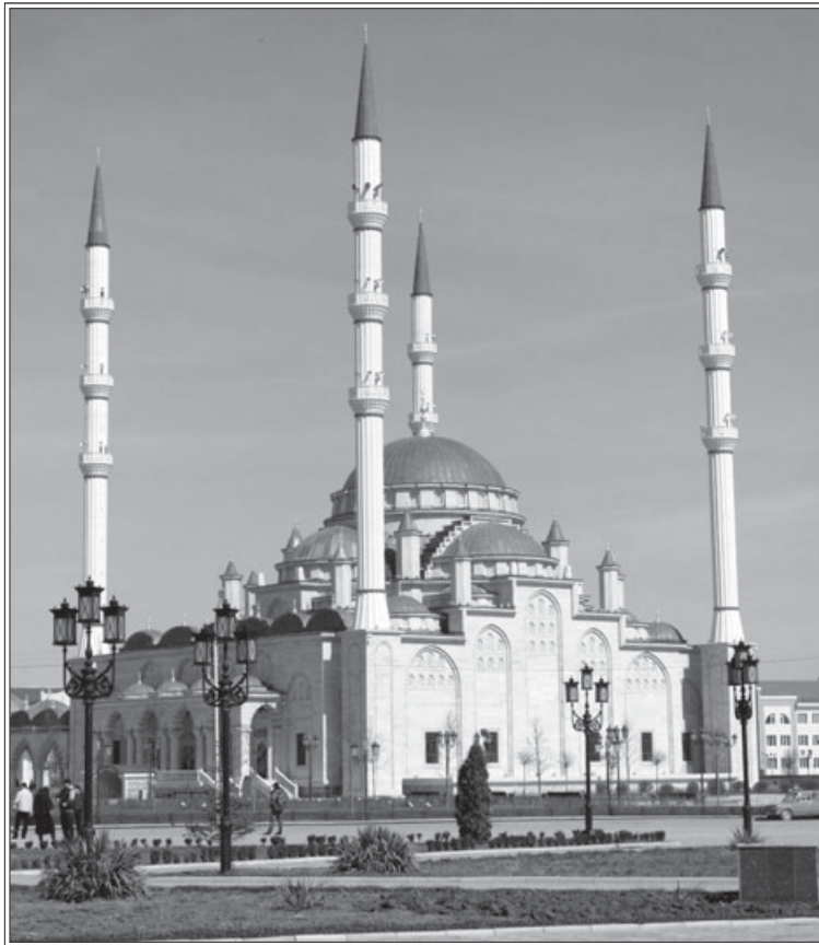
Грозненская центральная мечеть имени Ахмада Кадырова, претендующая на звание самой крупной в Европе, признана лучшим архитектурным проектом Евразии по версии международного журнала «Фёрст бизнес».

Верующие медицинские работники Великобритании обеспокоены участвующими случаями административных взысканий в отношении их наиболее религиозных коллег. В феврале медсестра из британского города Уэстон-Сьюпер-Мэр была отстранена от работы за то, что пред-