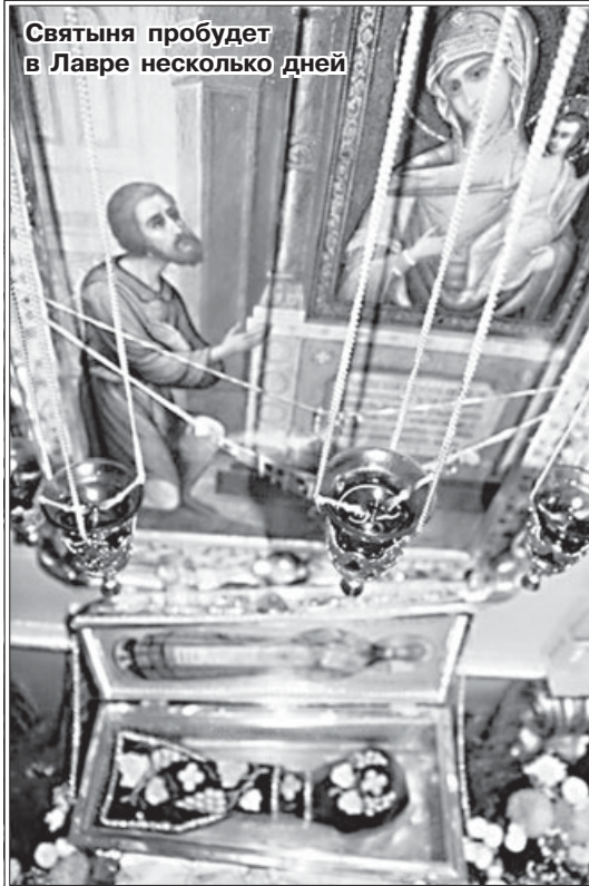
Святыня пробудет в Лавре несколько дней

Только чудом успел захлопнуть дверь, – рассказывает хранительница святыни.