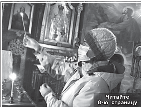
Читайте 8-ю страницу

Украинская Православная Церковь призывает духовенство и верующих к молитве за как