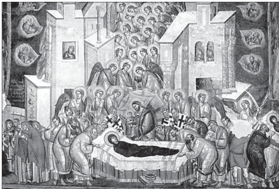
Министерство культуры Республики Македония получило грант в размере 650000 долларов от посольства США на реставрацию уникальных фресок церкви Богоматери Перивлепты в Охриде. Церковь Богоматери Перивлепты (с греческого – Прекрасной) была построена в конце XIII в. и расписана в 1295 г. греческими мастерами в стиле «Палеологовского ренессанса». Ее ктитормом был Прогон Сгур, родственник византийского императора Андроника II Палеолога. С XV в. до конца XIX в. церковь была центром Охридской архиепископии. Ныне находится в ведении непризнанной в православном мире Македонской Православной Церкви. Православие.Ru. Фреска Успение Пресвятой Богородицы. Охрид. Церковь Богоматери Перивлепты (XIII в.)

3 ноября Европейский суд по правам человека удовлетворил иск итальянки с финскими корнями Соиле Лаутси, требовавшей убрать из школ религиозные символы. Лаутси настаивала, что хочет дать своим детям светское образование, а по-