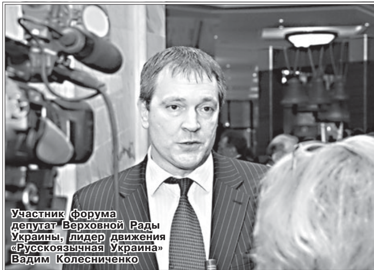
Участник форума депутат Верховной Рады Украины, лидер движения «Русскоязычная Украина» Вадим Колесниченко

Важно и далее развивать паломничество верующих из разных концов Русского мира к общим святыням. Для этого надо открывать паломнические центры и службы, составлять маршруты, делать хорошее информационное обеспечение, готовить специалистов в этой области.