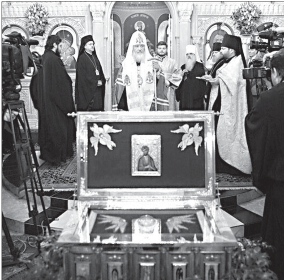
В ходе однодневного визита в Баку, Святейший Патриарх Московский и всея Руси Кирилл провел встречу с Президентом Азербайджанской Республики И. Алиевым, совершил молебен в кафедральном соборе святых Жен-мироносиц, принял участие в торжествах по случаю 60-летия со дня рождения и 30-летия пребывания в сане шейх-уль-ислама председателя ДУМ Кавказа Аллашукюра Паша-заде и встретился с Католикосом-Патриархом всея Грузии Илией II. В завершение визита Предстоятель Русской Церкви посетил торжественный прием во дворце «Бута-Палас» Фото: Молебен перед ковчегом с частицей мощей святого апостола Варфоломея – небесного покровителя города Баку.

Конечно, сам жанр кино предполагает определенный гротеск. Кино не является целиком реалистическим отражением жизни. Нужно быть очень зорким духовно