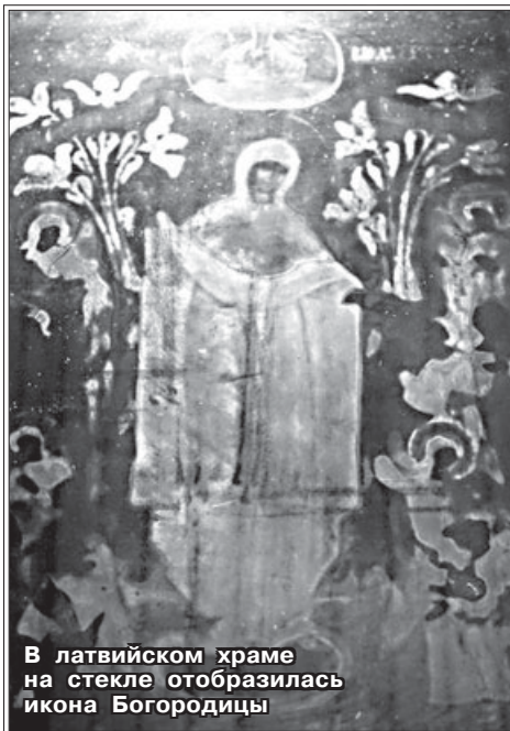
В латвийском храме на стекле отобразилась икона Богородицы