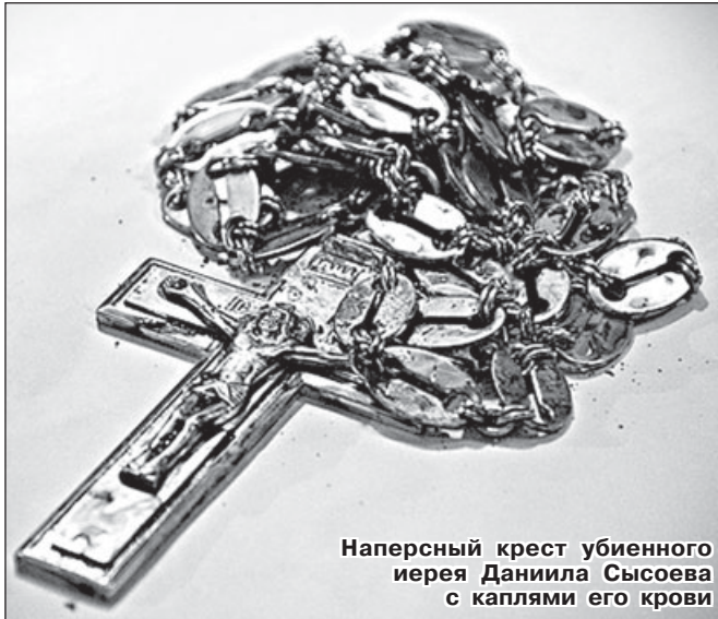
Наперсный крест убиенного иерея Даниила Сысоева с каплями его крови

ворил Спаситель: «Приду опять и возьму вас к Себе, чтобы и вы были, где Я... Увижу вас опять, и возрадуется сердце ваше, и радости вашей никто не отнимет у вас» (Ин. 14: 3; 16: 22).