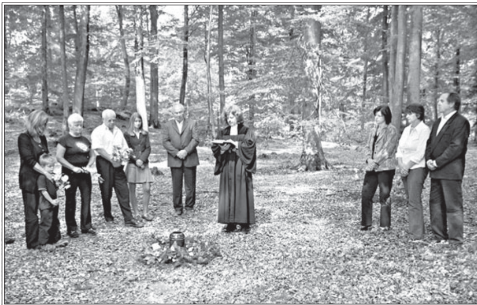
В последние годы жители Германии все чаще отказываются от традиционных похорон на кладбище и предпочитают обрести вечный покой под лесным деревом

жки среди американских иерархов, ему придется обращаться с жалобой в Ватикан. При этом наблюдатели отмечают, что шансов на успех в этом случае у него будет совсем немного.