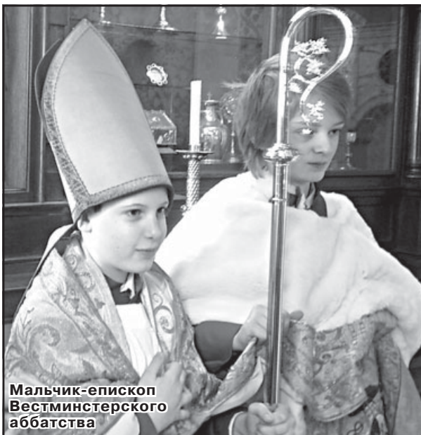
Мальчик-епископ Вестминстерского аббатства

6 декабря, в день памяти св. Николая – покровителя детей, во время вечерней мессы, действующий епископ уступал свой трон мальчику, который исполнял роль прелата до 28 декабря. Товарищи мальчика-епископа одевались в облачения священников (специально шитые на детей), и сопровождали его в процессиях по городу. Если мальчик умирал в период своего «правления», его хоронили с почестями, положенными прелату. В соборе