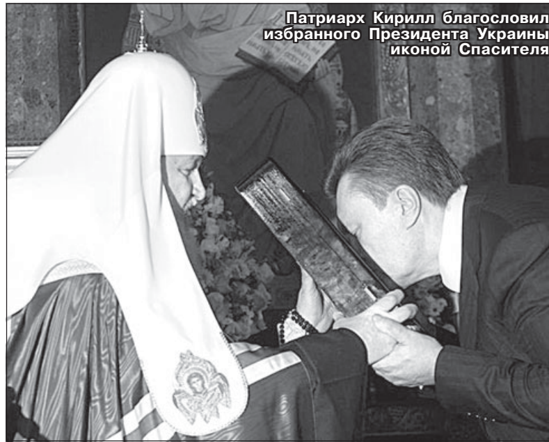
Патриарх Кирилл благословил избранного Президента Украины иконой Спасителя

К сожалению, моя программа очень ограничена. Уже сегодня в 4 часа пополудни я должен в Москве принять президента Ливана. Поэтому сейчас после краткой трапезы вынужден сразу отправиться в аэропорт. Прошу ваших святых молитв, потому что верю, что вашими молитвами, молитвами Церкви Господь помогает мне нести крест на мое патриаршее служение. Храни вас Господь!».