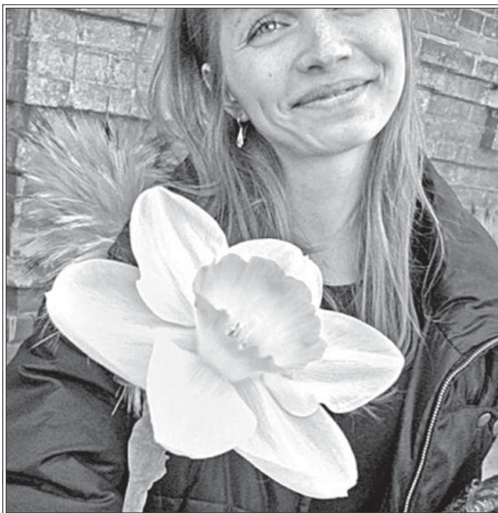
Фото: Останнім часом святкові заходи з нагоди дня жінок-мироносиць відбуваються у багатьох православних храмах. Привітання від чоловіків – священослужителів та прихожан – отримують не тільки парафіянки, але й прості перехожі. Минулого року у Барнаулі відбулася масштабна акція: усім жінкам, що проходили біля храмів дарували нарциси, іконки із зображенням святих жінок-мироносиць та буклети з розповіддю про свято.

Говоря о проблемах, связанных с сохранностью переданных религиоз-