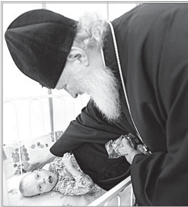
Затем Святейший Патриарх Кирилл посетил отделение милосердия, благословил тяжелобольных детей и подарил им пасхальные сувениры.

Патриарх Московский и всея Руси Кирилл призвал верующих как можно чаще причащаться. «Сегодня, когда в полной свободе мы имеем возможность