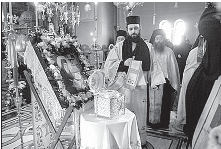
В честь чудесного возвращения мощей св. Никодима в монастыре была отслужена торжественная всенощная служба, а ковчег положен для поклонения верующих