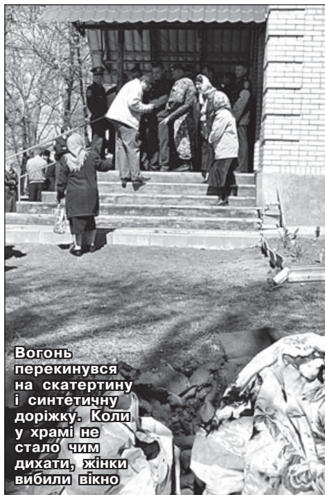
Вогонь перекинувся на скатертину і синтетичну доріжку. Коли у храмі не стало чим дихати, жінки вибили вікно

– положення статті 194 КК України, відповідно до якої визнається злочином умисне знищення або пошкодження чужого майна, що заподіяло шкоду у великих розмірах;