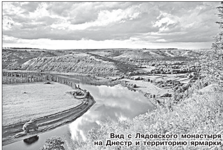
Вид с Лядовского монастыря на Днестр и территорию ярмарки.

Промышленных товаров на Лядовской ярмарке тоже будет предостаточно – и ведущие производители Украины, и небольшие про-