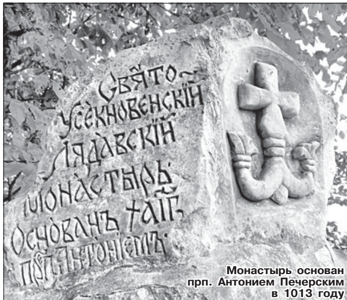
Монастырь основан прп. Антонием Печерским в 1013 году

изводственные цеха, и торговые фирмы захотели участвовать в необычном мероприятии. Народные умельцы и мастерские художественных промыслов выставят для посетителей много красивых и полезных изделий.