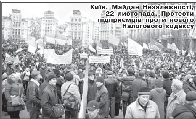
Київ, Майдан Незалежності, 22 листопада. Протести підприємців проти нового Налогового кодексу

На що очікувати віруючим і релігійним організаціям України?