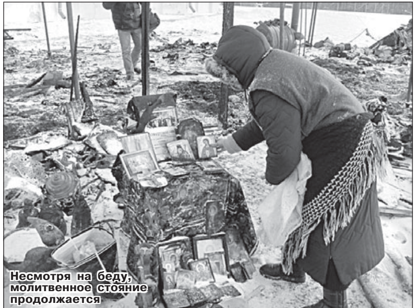
Несмотря на беду, молитвенное стояние продолжается

Сам Чернигов символизирует собой единство Руси! И здесь хотят сделать ядро на-