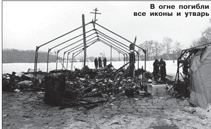
В огне погибли все иконы и утварь

то в архиве, я нашел архивные данные, которые отправил президенту, премьер-министру, председателю Верховной Рады, губернатору области. Это 60 листов архивных документов с печатями – с царского времени до 30-х годов XX века, где показано, что этот приход был приходом Московской Патриархии. Мы пытаемся решить вопрос на законном основании, и наши доводы простые: храму 300 лет, а «Киевский патриархат» как религиозная организация возник в 1992 году и никакого отношения к этому храму не имеет. Но пока в ответ – никакой реакции. То есть документально правда на нашей стороне: это была незаконная передача. Если властью будет принято решение передать храм нам, то можно бу-