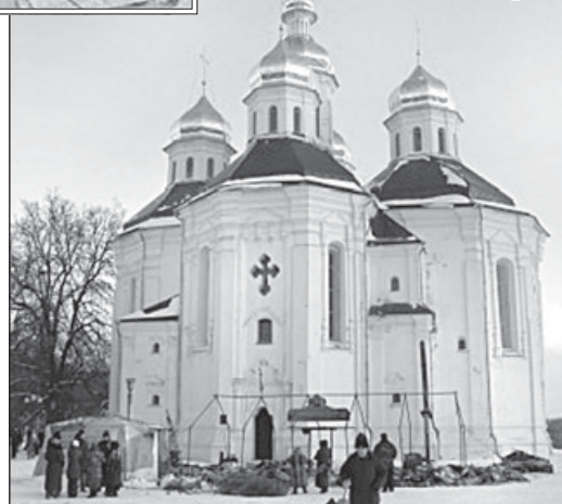
Екатерининский собор Чернигова передан общине УПЦ-КП

спланированное групповое нападение. А все пытаются представить совсем по-другому. На местном уровне стараются дело закрыть.