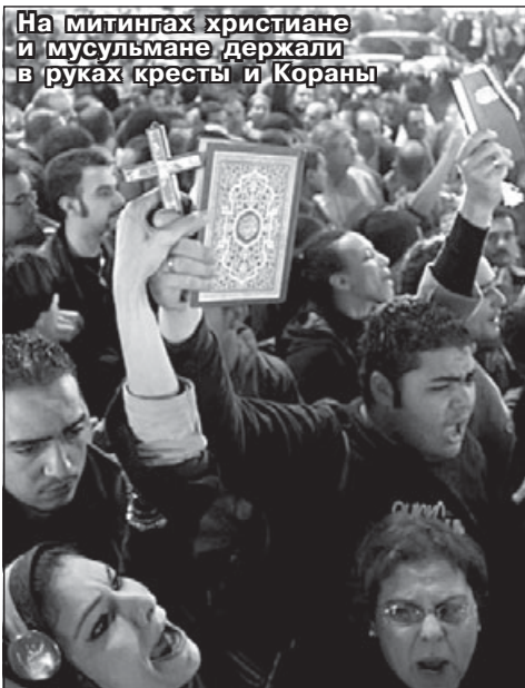
На митингах христиане и мусульмане держали в руках кресты и Кораны

также большое число знаменитостей – деятелей искусства. Трансляция Рождественской службы велась по центральным каналам египетского телевидения.