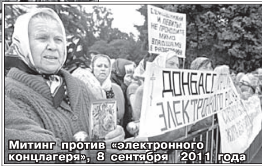
Митинг против «электронного концлагеря», 8 сентября 2011 года

нения в закон, а потребовал отменить его в целом. Предложение Президента, направленные в Раду, оформлены довольно необычно – они содержат не только юридические выкладки, но и свободное изложение опасений главы государства: