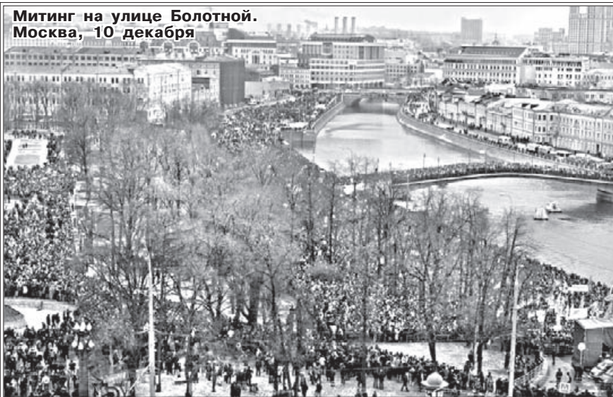
Митинг на улице Болотной. Москва, 10 декабря

рые затевают такие социальные процессы, нас не жалуют, мы им не нужны, более того, у них всегда есть возможность отхода, – отметил священник. – Никто из Временного правительства, например, не пострадал. Почти все уехали и дожили до глубокой старости, у всех было, на что жить».