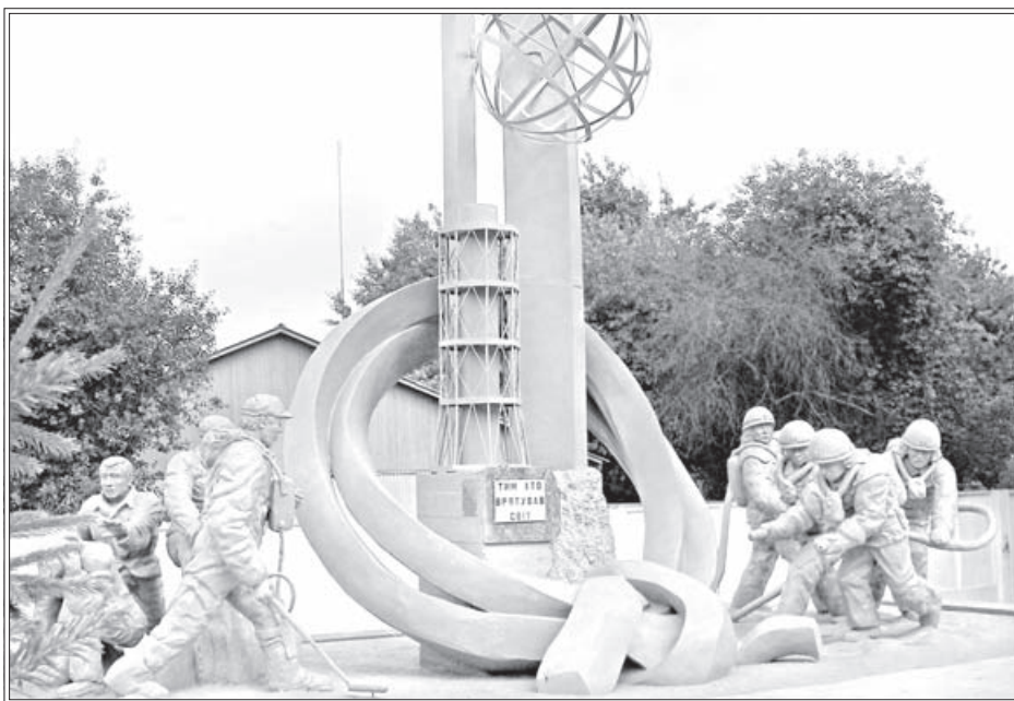
В епархиях Украинской Православной Церкви совершены молебны о здравии ликвидаторов аварии на Чернобыльской АЭС. Богослужения проходили в день 25-летия завершения строительства защитного сооружения («саркофага») над разрушившимся четвертым энергоблоком ЧАЭС (14 декабря 1986 года). С 2006 года в этот день на Украине отмечается День чествования участников ликвидации последствий аварии на Чернобыльской атомной электростанции. Патриархия.Ru

«Русская Зарубежная Церковь всегда называла себя лишь одной частью