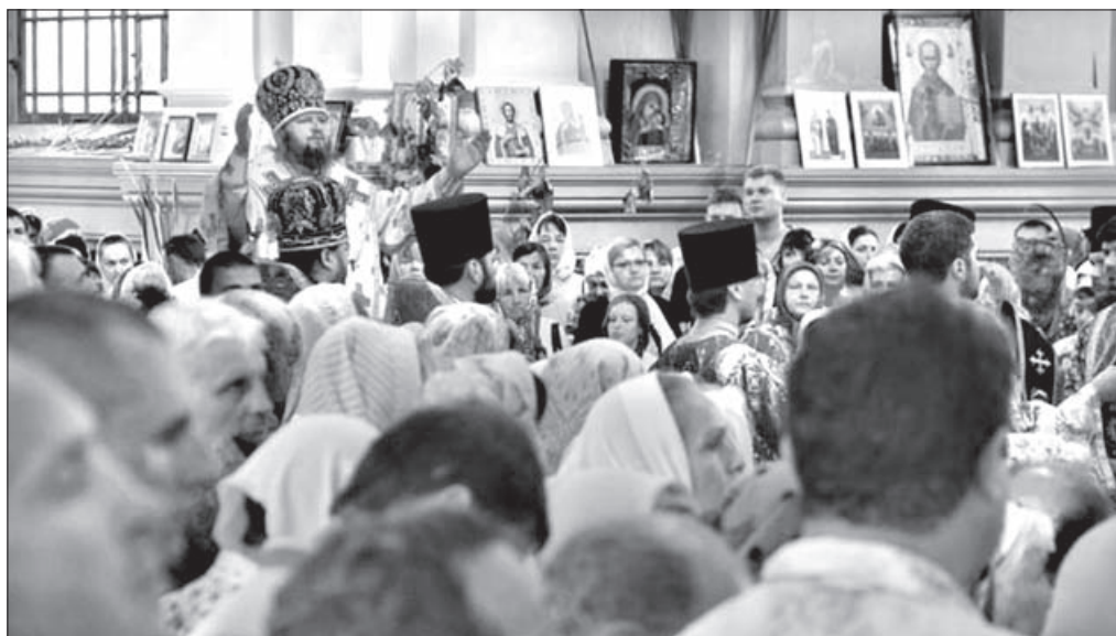
Архиепископ Евлогий служит Литургию в Троицком архиерейском соборе г. Сумы

В частности, люди сообщают, что так называемый «архиепископ Мефодий» посещает районные государственные администрации Сумщины и в общении с их руководителями давит на них с требованием передать общинам УПЦ КП церковное имущество существующих приходов Сумской епархии Украинской Православной Церкви, или же, как