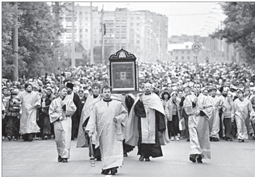
Крестоходцы выходят из Кирова с Великоорецкой иконой Николая Чудотворца

67 тысяч верующих приняли участие в Великоорецких торжествах – это на 8000 больше, чем в прошлом году. Крестный ход собрал 33 000 паломников: они прошли более 150 км, сопровождая чудотворную икону святителя Николая. На месте явления образа 6 июня в селе Великоорецкое была совершена Литургия. В этом году крестный ход праздновал два юбилея: 400-летие с момента второго путешествия Великоорецкого образа свт. Николая в Москву и 25 лет со времени возрождения крестного хода. Nabludatel.ru.