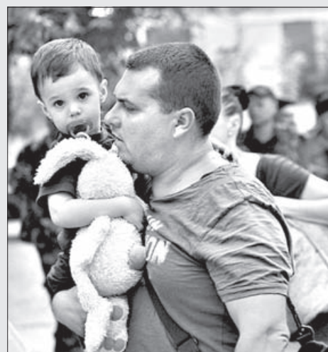
Мужчина несет на руках своего сына, покидая дом в Луганске

Интерфакс-Религия, Православие в Украине