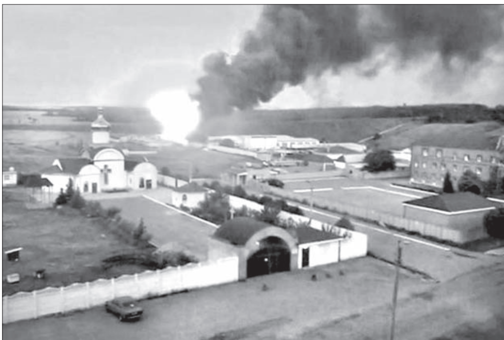
Обстрел пограничной части в Луганске. Храм Андрея Первозванного

В случае продолжения обстрелов города верующие Луганска намерены оборудовать бомбоубежище. Его планируют устроить в подвале местного Вознесенского храма.