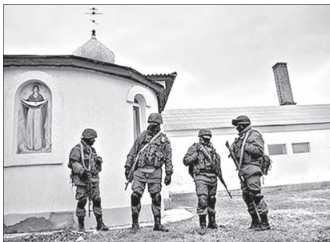
Вооруженная группа людей возле Покровского храма УПЦ-КП

Всем известно отличие во взглядах между религиозными конфессиями в Украине. Также и взаимные отношения между отдельными Церквями или их местными общинами не всегда лишены противоречий, в том числе в имущественных