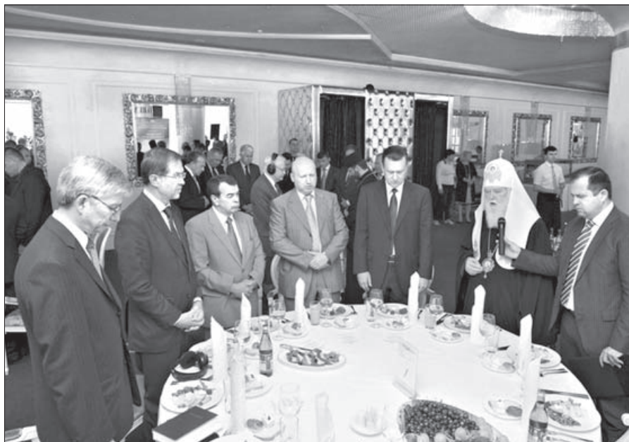
Глава раскольничьей УПЦ-КП «патриарх» Филарет читает «Отче наш»

Канон 1024 Кодекса канонического права Католической Церкви гласит, что только крещеные лица мужского пола могут быть рукоположены в священники. По мнению участников движения «Womanpriest Catolica Romana», которое насчитывает по всему миру 140 женщин-«священников», этот канон дискримини-