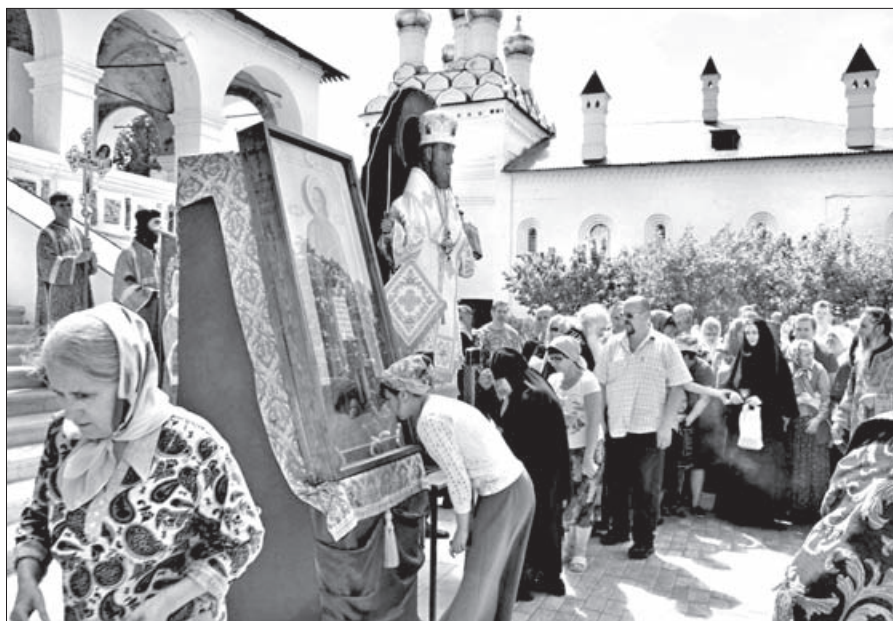
Верующие прикладываются к древнему образу свт. Николая (Можайского)

Тем временем турецкая интеллигенция начала кампанию по сбору подписей за сохранение собора Святой Софии в