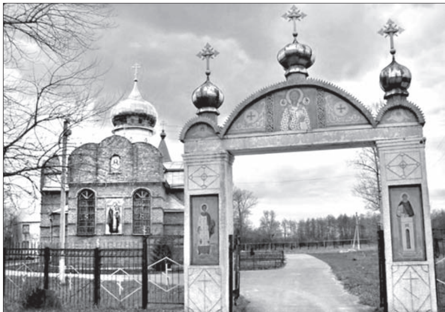
Николаевский храм в станице Луганской, фото 2006 года