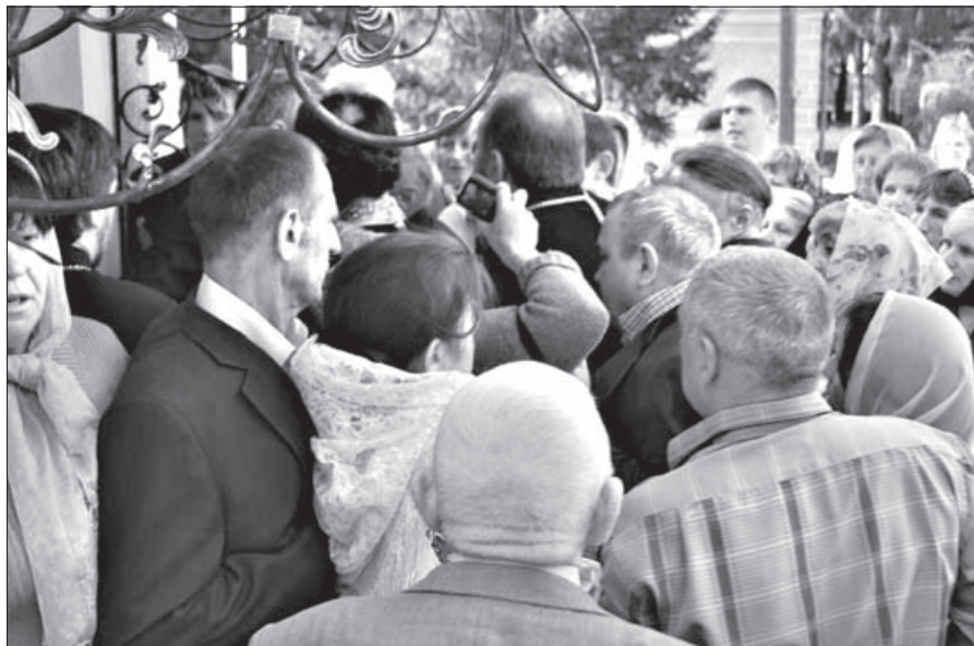
Захват храма в селе Угринов Гороховского района Волынской области

Он также сообщил, что среди перешедших в КП приходов два ровенских, два на Волыни и два на Буковине. Пока УПЦ ищет мирные способы решения пробле-