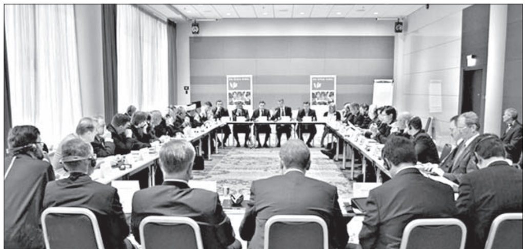
Заседание межконфессионального «круглого стола» в Осло (Норвегия)

участников конфликта ни при каких обстоятельствах не допускать действий, унижающих человеческое достоинство, не использовать пытки, не допускать похищения людей, в том числе с целью выкупа, а также противодействовать мародерству», – подчеркивают религиозные лидеры Украины и России.