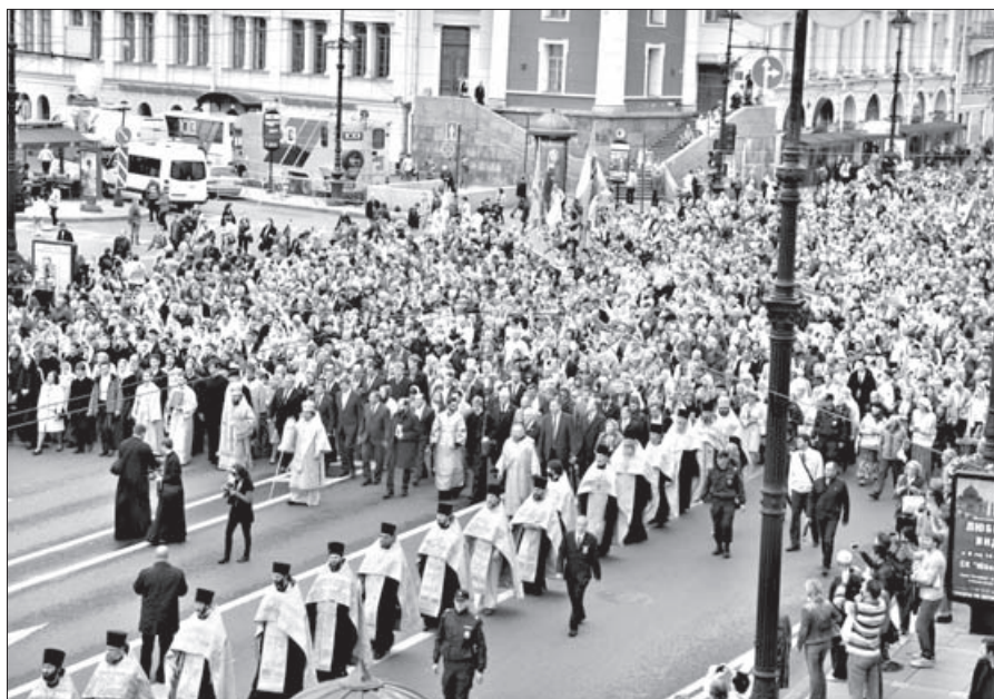
Крестный ход движется по главной магистрали Петербурга

День 290-летия перенесения мощей святого Александра Невского, 12 сентября, отпраздновали в Петербурге. После Божественной литургии и освящения главного, 18-тонного колокола для звонницы Свято-Троицкого собора Александро-Невской лавры, по улицам северной столицы России прошел масштабный крестный ход с мощами небесного покровителя Петербурга. В молитвенном шествии по Невскому проспекту приняли участие 90 тысяч человек. Православие.Ru .