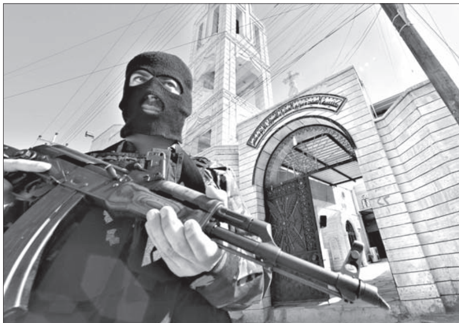
Боевик ИГИЛ преграждает вход в христианский храм, Ирак

Священник пообещал любить врагов, отметив, что особую любовь к ним проявляла и будет проявлять «святая украинская земля». «Она с любовью принимает всякого ордынца, всякого захватчика, всякого врага, который пришел на нашу землю, чтобы ее осквернить. Наша земля открывает свое лоно и принимает его туда навсегда. Присмотрит она и эту московскую орду. Присмотрит как друга!» – заявил греко-католический священник.