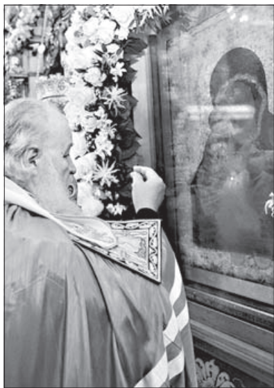
Предстоятель молится перед Донской иконой Богородицы

У нас должен быть навык молитвы, сказал в проповеди в Донском монастыре Патриарх Кирилл. «Иногда нам кажется, что Господь нас не слышит и Божия Матерь не слышит. Каждый из нас через это проходил. Вроде и горячо молишься, – а ответа не получаешь, – сказал Святейший. – В том не Господь виноват – в том виноваты мы. Значит, что-то происходит в нашем сознании».