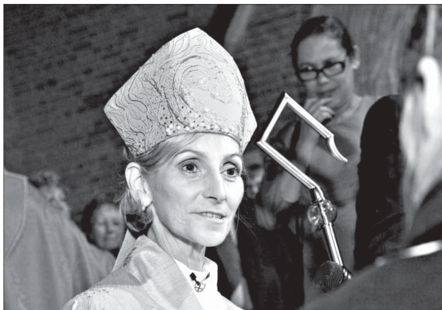
Кей Голдсворти – первая женщина-епископ Англиканской Церкви Австралии

В Великобритании продолжается процесс по введению в Англиканской Церкви женского епископата. Без голосования данную идею 14 октября одобрила Палата лордов британского парламента. Предложение Генерального Синода Англиканской Церкви, вероятно, будет официально утверждено парламентом уже на будущей неделе, что узаконит женское епископство в Британии. Предположительно, первое посвящение женщины в этот сан произойдет до конца нынешнего года. Фома.Ru.