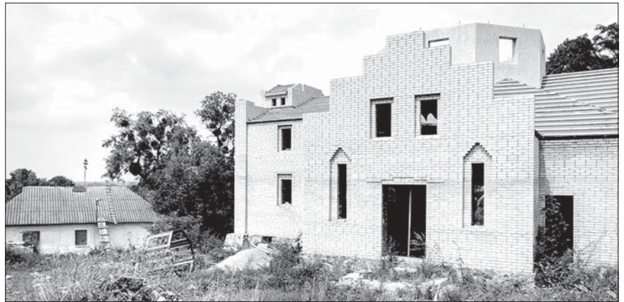
Старый (слева) и строящийся храм в честь первомученика Стефана, с. Чернятин

Раскольники ведут активную работу среди жителей села Чернятин Жмеринского района Винницкой области, убеждая передать строящийся храм УПЦ в честь первомученика Стефана «Киевскому патриархату».