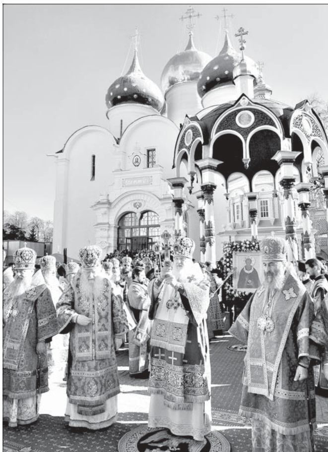
Патриаршее служение в Троице-Сергиевой лавре в день памяти преподобного Сергия Радонежского

По словам Первосвященителя, даже внешне сильный и могущественный человек, обладающий властью и деньгами, «может стать легкой добычей своих собственных слабостей, если он неспособен одержать главную победу – победу над самим собой». Без