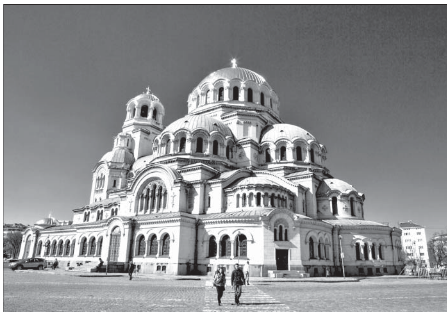
Храм-памятник святого благоверного князя Александра Невского

Собор св. Александра Невского в Софии стал собственностью Болгарской Церкви. Акт права собственности на Патриарший кафедральный храм-памятник вручен Патриарху Болгарскому Неофиту. Предстоятель, в свою очередь, передал главе временного правительства Болгарии Георгию Близнашки подписанный договор о праве Министерства культуры безвозмездно и бессрочно использовать крипту собора для размещения экспозиции Музея раннехристианского искусства. Седмица.Ru.