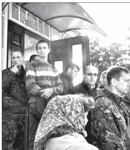
Вход в храм блокируют сторонники КП

лении готовят судебные иски по поводу неправомерных действий местных чиновников, которые пренебрегли законодательством Украины.