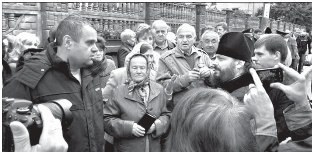
Сторонники «Киевского патриархата» не пускают епископа Филарета в храм