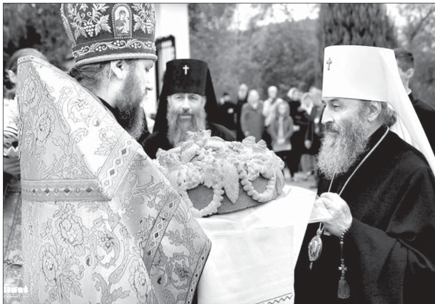
Встреча Блаженнейшего Митрополита Онуфрия в Святогорской лавре, 5 октября

«Что означают наша терпимость и безразличие к такого рода фактам? – спрашивает иерарх. – Разве не ясно, что искажая собственную историю, пренебрегая своими ценностями, топчя, сжигая и разрушая символику нашего народа, мы попадаем в опасное иго и оккупацию внешнего врага, который является нашим «кредитором».