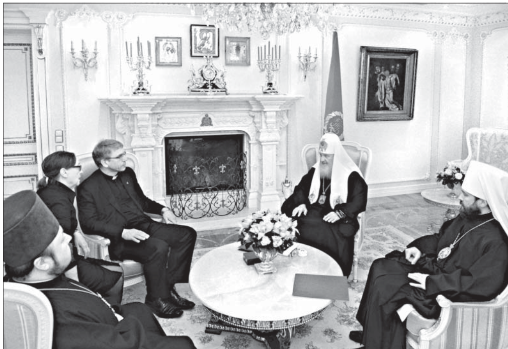
Встреча Патриарха Кирилла с генеральным секретарем ВСЦ Олафом Фюксе Твейтом

«И именно в последнее время, обращаясь к своей украинской пастве, я постоянно говорю о том, что для того, чтобы наступил настоящий