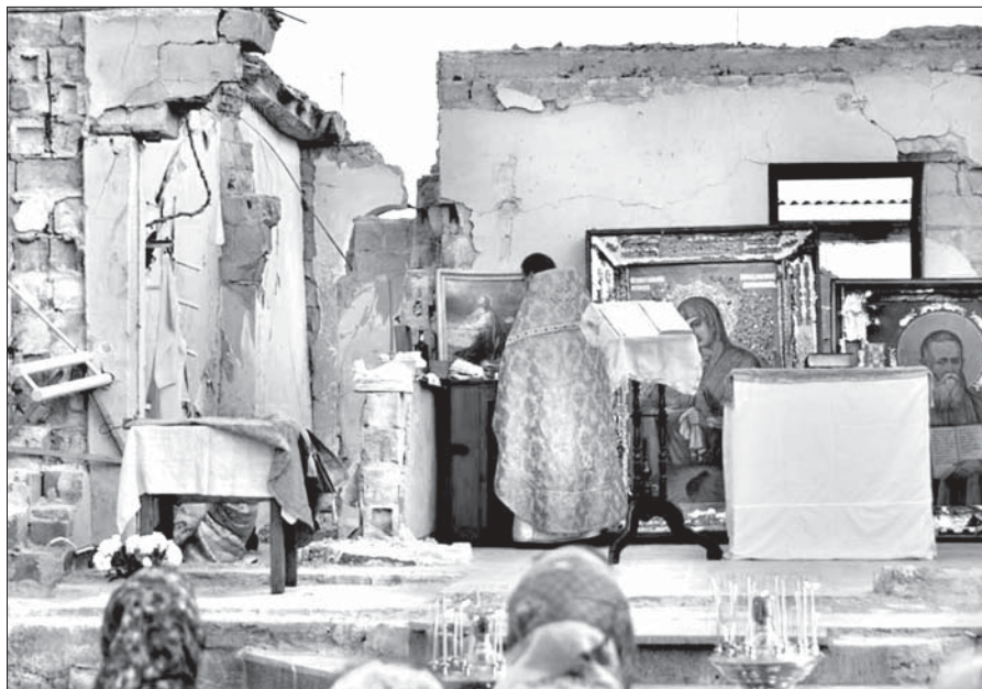
Литургия на руинах храма святого праведного Иоанна Кронштадтского

«Мне доводилось участвовать в некоторых дискуссиях в рамках Совета Европы на эту тему. Когда речь заходила о необходимости принятия какого-то документа Совета Европы, признающего вопиющее насилие в отношении христиан на Ближнем Востоке, то всегда находились люди, которые высказывались против такой конкретизации и предла-