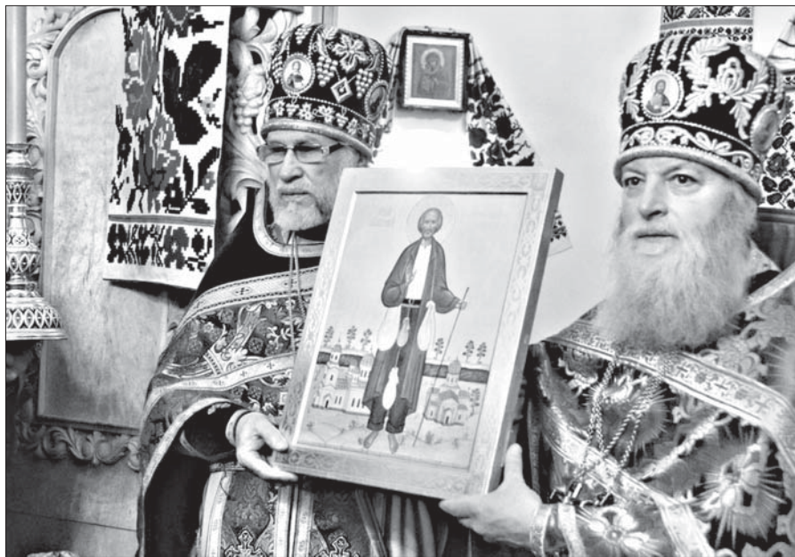
Священники держат в руках икону блаженного Варфоломея

В последний день ноября в село Бадовка Острожского района на автобусах были завезены боевики местной «Самобороны» и представители так называемого «Киевского патриархата». Община приняла решение не открывать храм и печатать его. Церковь окружили сотрудники милиции, защитив здание от возможных нападков агрессивно настроенных националистов, которые выкрикивали оскорбления в адрес верующих и