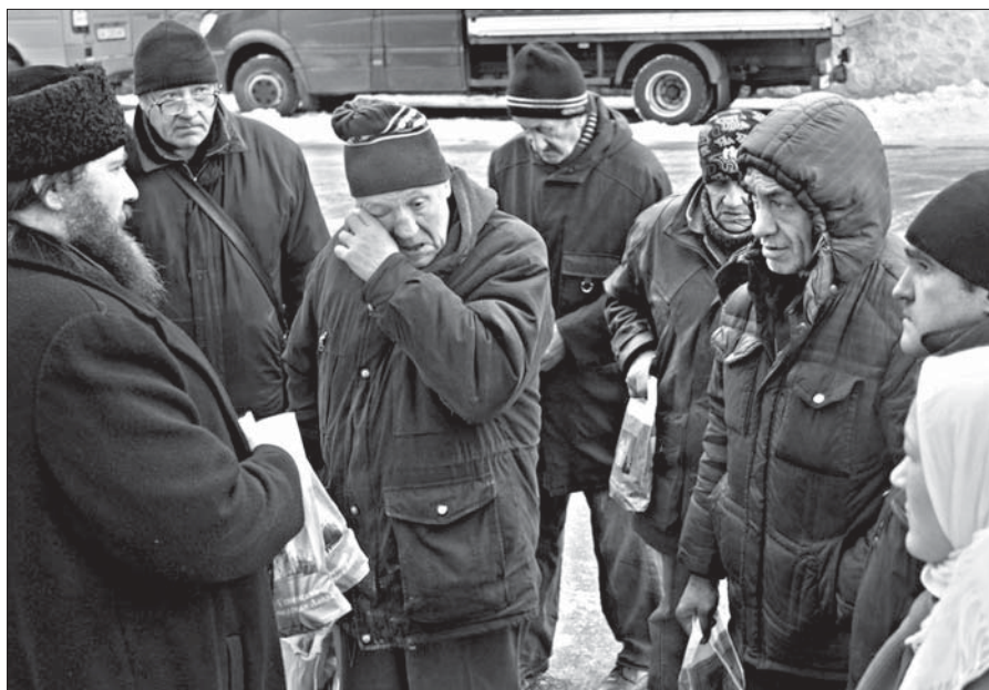
Представитель Социального отдела лавры раздает бездомным помощь

Во время разговора речь шла и о преодолении раскола в Болгарской Православной Церкви. В настоящее время пос-