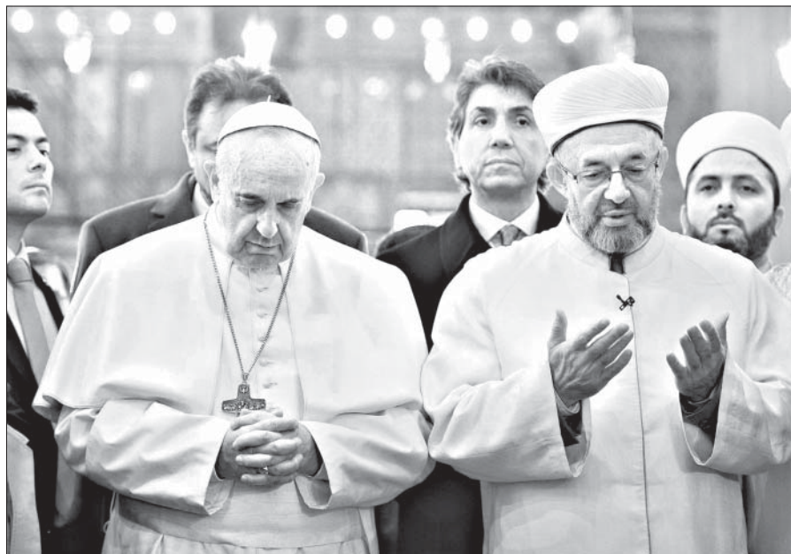
Папа молится в Голубой мечети – главной мусульманской святыне Стамбула