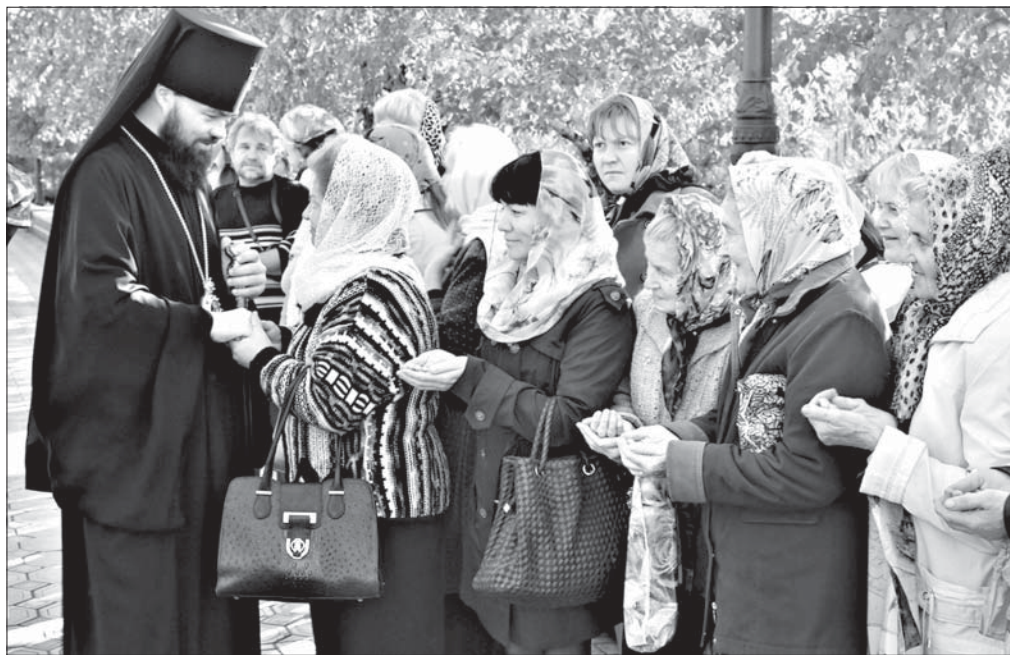
Архиепископ Митрофан (Никитин) благословляет верующих

Это тысячи беженцев, которые побросали свои дома, спасаясь из зоны боевых