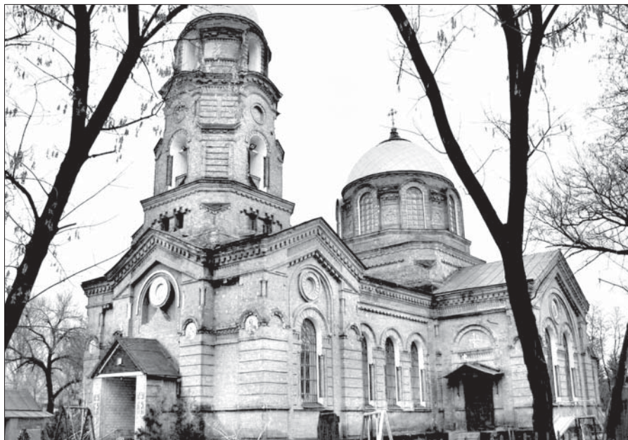
Покровский храм села Трёхизбенка, Славяносербский район Луганской области

5 декабря. Власти Израиля решили ограничить внешние проявления молитвы в